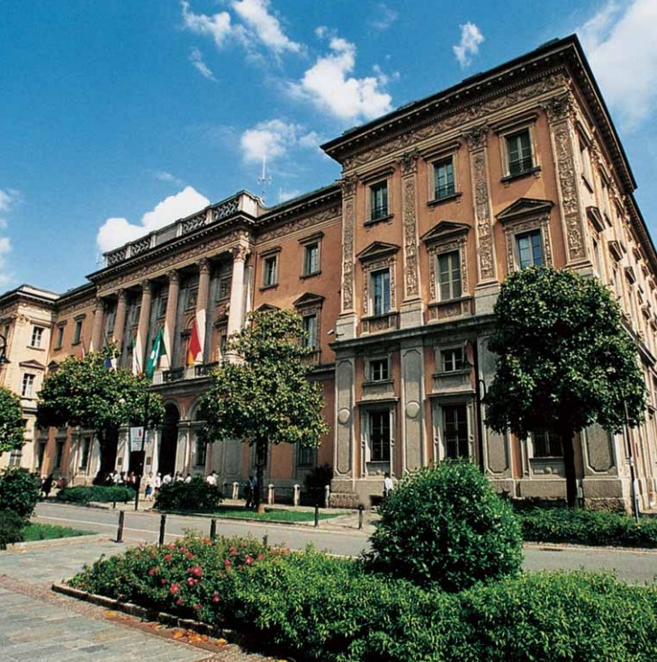
Palazzo della Provincia di Bergamo